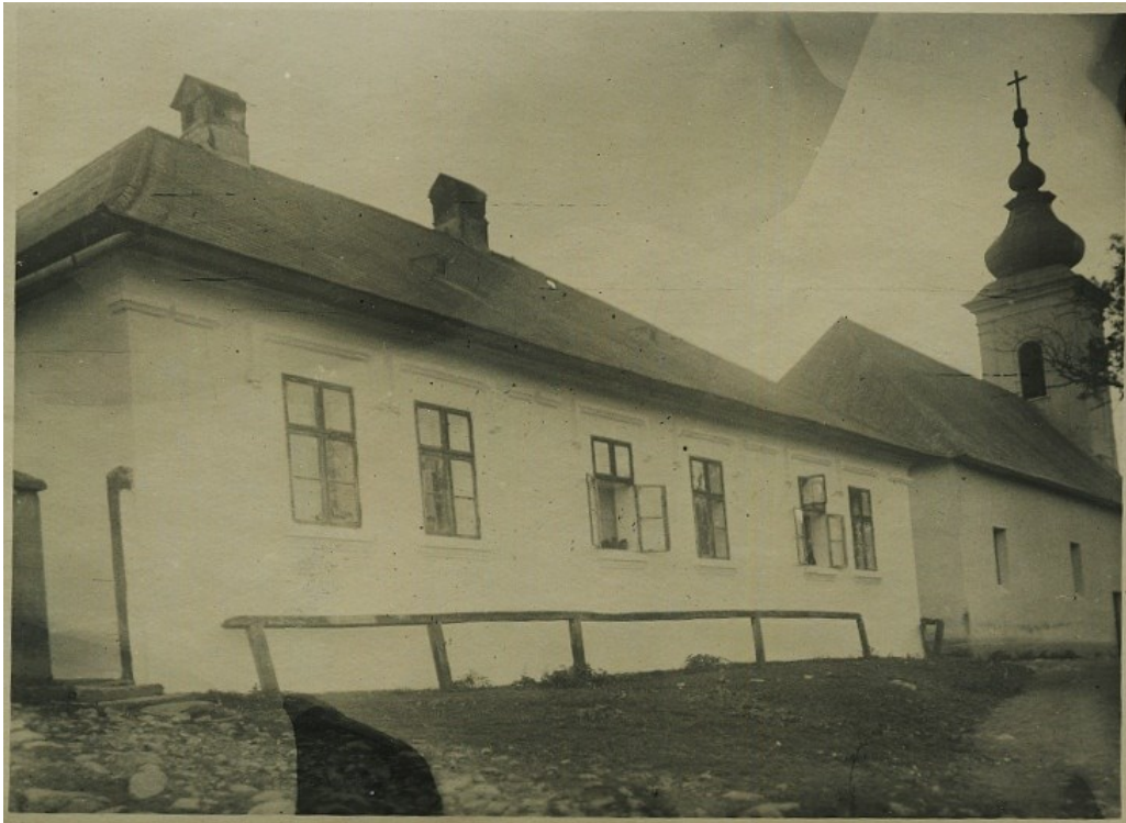
Historická fotka, pôvodný stav samotnej fary aj kostola pred druhou svetovou vojnou. Cez vojnu spadla blízko fary bomba, zostala zničená celá uličná fasáda - sú vymenené okná, a zmizli plastické dekorácie na fasáde, tzv. šambrány a pilastre. A veža kostola ešte s pôvodnou tzv. cibul'ou kupoly.