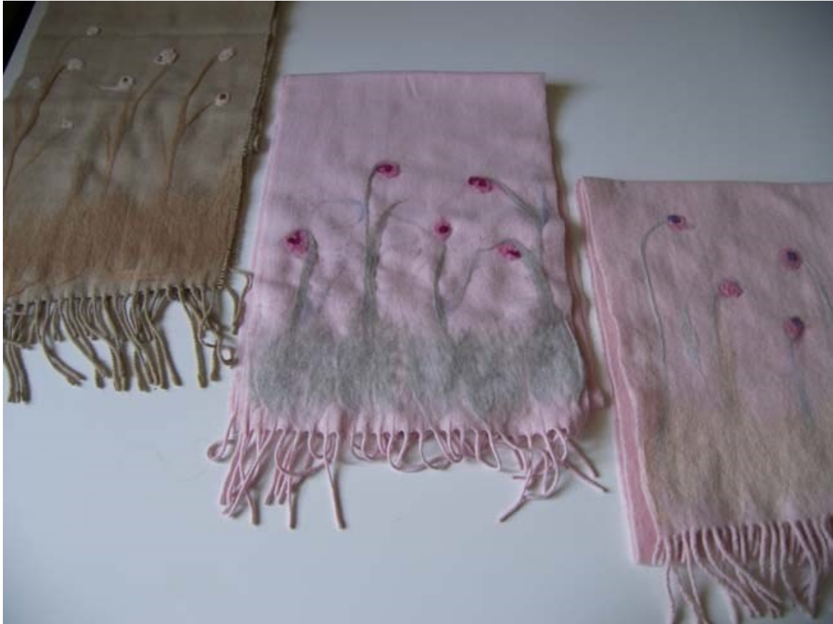
Tri šále s kvetmi ako ukážka plstenia, ručnej práce s vlnou merino. Možnosť naučiť sa počas kurzov